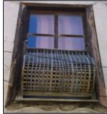
Resim 6: Haytalar Konağı vitraylı pencere ve ahşap pencere kafesi

Çıkmalar: Evin oturma alanının genişletmek için yapılan çıkma, güneş ışığından daha fazla yararlanmayı sağlamakla beraber duvar ve pencereleri yağmur suyundan korumak için yapılmıştır. Çıkma, yataylamasına gelen kirişleri, dikey gelen kirişlerle yükselterek ve genişleterek elde edilir. Böylece dıştan da daha güzel bir görüntü meydana gelir [1].