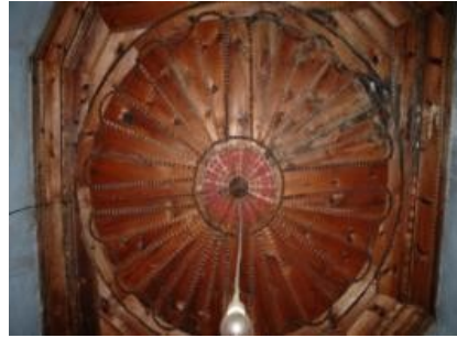
Resim 11: Tekkeliler Konağı tavan detayları