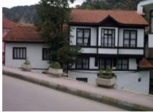
Resim 17: Hızarcılar Konağı (eski ve yeni hali)