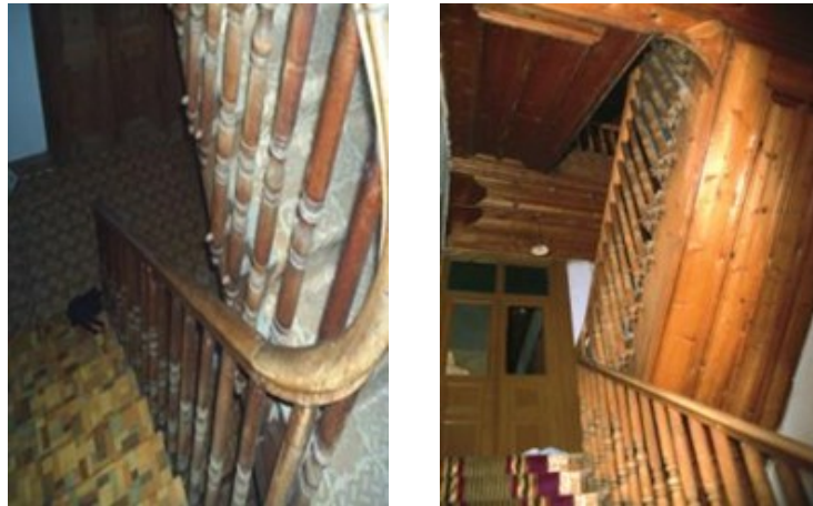
Resim 2: Armutçular Konağı haremlik ve selamlık merdiveni

Harem ve selamlık: Ailenin oturduğu kısım olan selamlık, haremden daha büyük de olabilir. Genellikle bina harem ve selamlık kısımları ile çift ev haline gelmiştir. Birbirlerine kapılarla bağlı olan ve ayrı iki merdiveni bulunan bu iki kısım da mabeyn denilen ara oda ve sofalar vardır. Genelde dış kapı da kalın ve ince ses çıkaran iki farklı kapı tokmağı mevcuttur. Misafir erkeğe kalın tokmağı kullanır ve kapıyı erkek açar, kadınsa ince tokmağı kullanır ve kapıyı kadın açar. Bu sayede bölgenin ahlaki ve dini değerlerine de sahip çıkılmış olur. Zengin evlerde evin efendisi bütün gününü selamlıkta geçirir, kadınlar ise haremden oturur, misafirlerini ağırlarlardı [1].