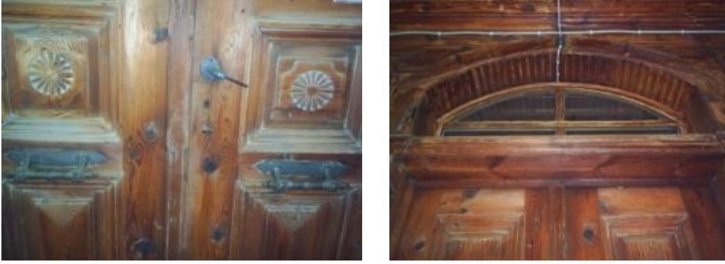
Resim 1: Armutçular Konağı giriş kapısı üstü detayı

Kapılarda ve genel olarak birçok yerde Mudurnu'nun yerli sarıçamı kullanılmış, zamanla bozulmasın diye de koruyucu boyalarla boyanmış ve günümüze kadar ulaşmıştır. Evlerin bahçesinde, her şeyden önce bir çeşme, bir kuyu ya da bir havuzu vardır. Buradan akan su, bahçeyi sulamaya gider. Sadece bahçe sulamak için çeşmeden su kullanmak su kaynaklarının gereksiz kullanımından dolayı bölgede hoş karşılanmayan bir durumdur. Bahçenin bir bölümü sebze, bir bölümü de çiçeklere ayrılmıştır. Elden geldiğince çeşitli meyve ağaçları vardır.