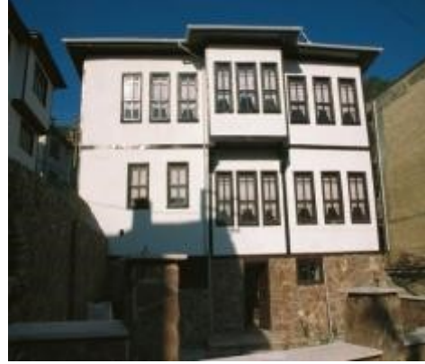
Resim 13: Hacı Abdullahlar Konağı (eski ve yeni hali)