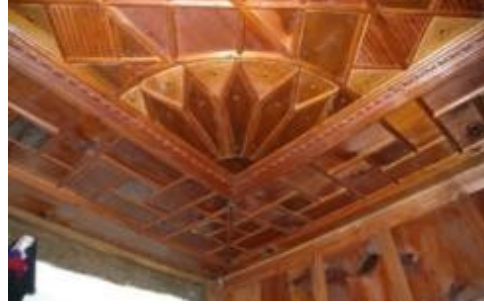
Resim 9: Hacı Şakirler Konağı tavan detayları