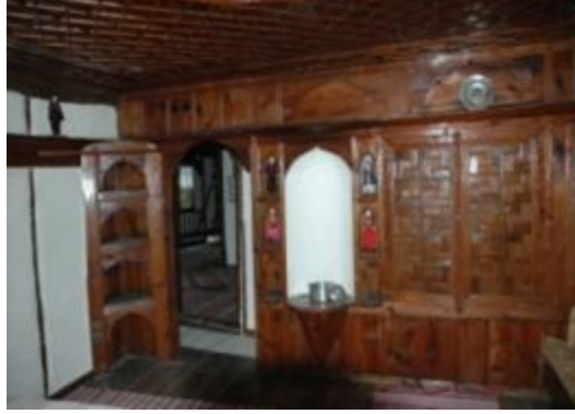
Resim 5: Hacı Şakirler Konağı duvar kaplaması

Kaplamalar: Bazı evlerde dış cephelerde kaplama kullanılmış olmasına rağmen özellikle iç duvar kaplamalarında ahşap üzerine çeşitli motifler işlenerek duvar kaplamaları kullanılmıştır.