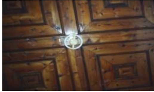
Resim 10: Mualla Kazan Konağı tavan detayları