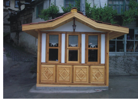
Resim 21: Belediye turistik eşya satış bürosu ve taksi durağı