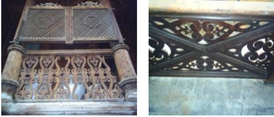
Resim 8: Armutçular Konağı korkuluğu

Korkuluklar: Yüzey oymacılığı ve kesme oymalar kullanılarak yapılan bu korkuluk motifleri günümüze gelene kadar tahrip edilmiştir. Bu korkuluklar dış kapı ile sokak arasında bir bölme görevi görür ve bu bölme giren çıkanın görünmesini engelleyerek ahlaki değerleri korumuş olur.