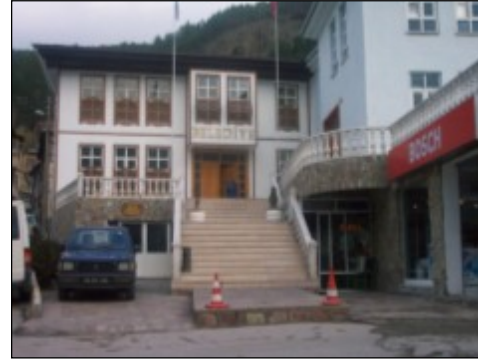
Resim 19: Belediye binası (eski ve yeni hali)

Belediye lojmanları ve dolmuş bekleme durakları ahşap kaplama ile kaplanarak geleneksel mimariye uygun hale getirilmiştir.