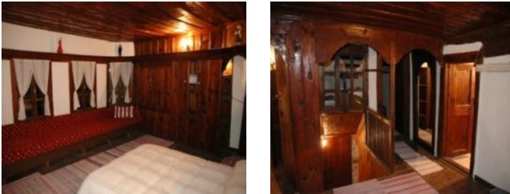
Resim 4: Hacı Şakirler Konağı (sofa ve sedir)