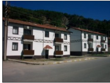
Resim 20: Belediye dolmuş durağı ve lojmanları

Büfeler ve satış büroları geleneksel Mudurnu evlerinin âdete bir minyatürü konumunda yapılarak bu mekânların değeri ve önemi bir kez daha hatırlatılmaktadır.