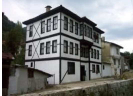
Resim 14: Hacı Şakirler Konağı (eski ve yeni hali)