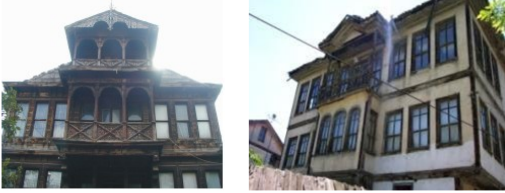
Resim 7: Çıkma detayları

Korkuluklar: Yüzey oymacılığı ve kesme oymalar kullanılarak yapılan bu korkuluk motifleri günümüze gelene kadar tahrip edilmiştir. Bu korkuluklar dış kapı ile sokak arasında bir bölme görevi görür ve bu bölme giren çıkanın görünmesini engelleyerek ahlaki değerleri korumuş olur.