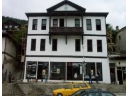
Resim 16: Donbaylar Konağı (eski ve yeni hali)